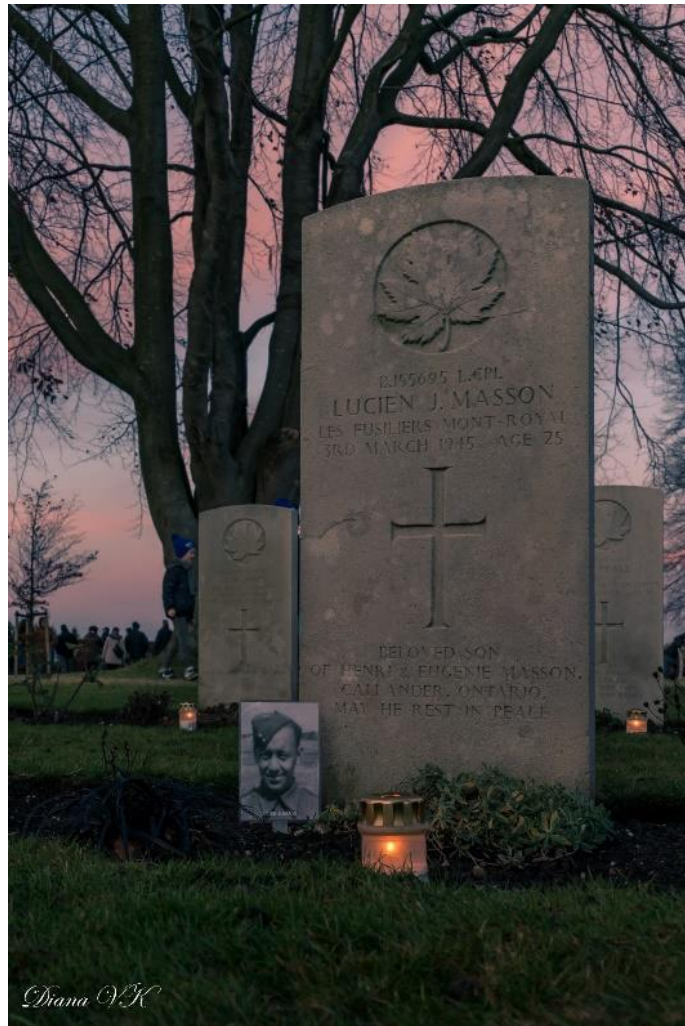
Lichtjesavond 24 december 2018.